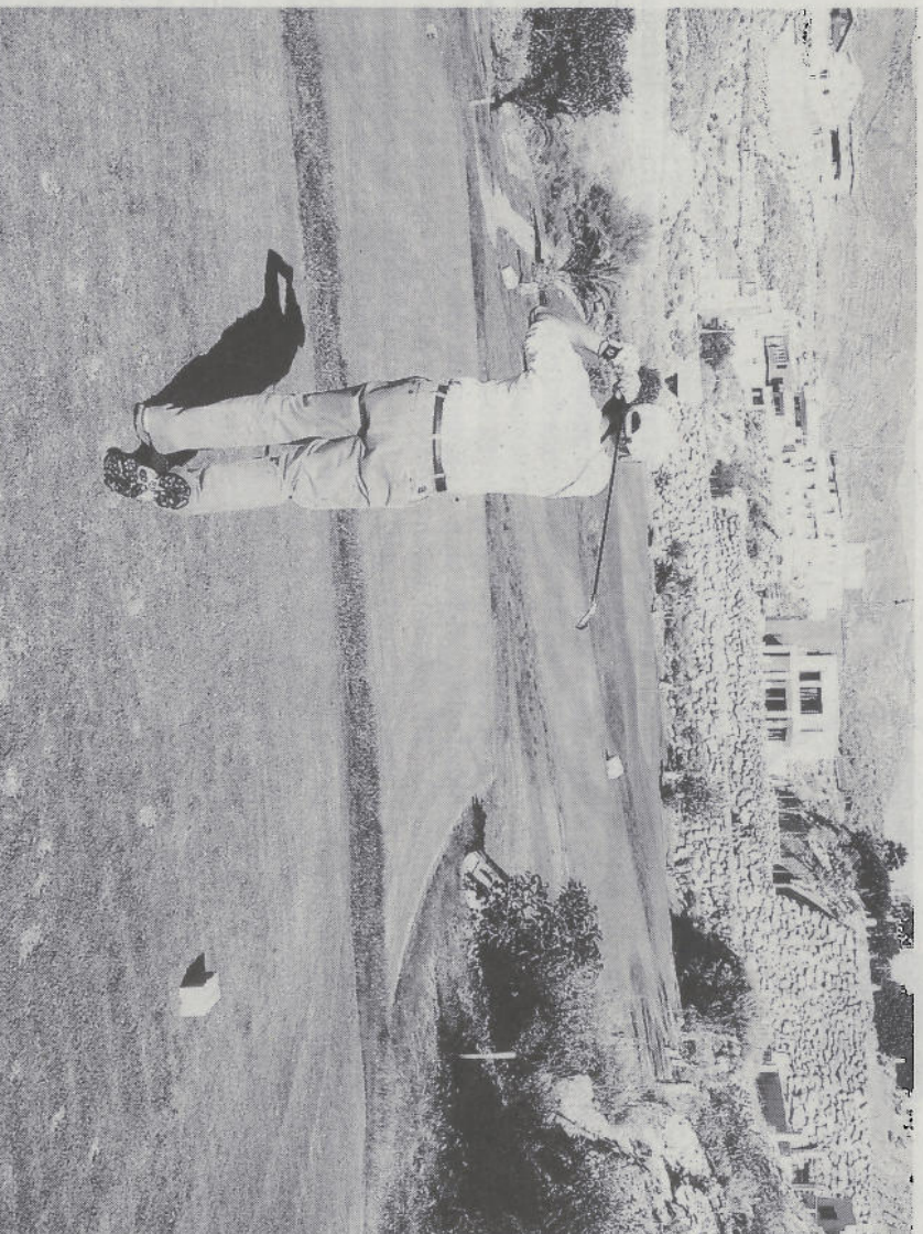
ANUAL. El Puntuable ha llegado a su segunda cita en La Envía y mañana, el 'Pro-Shop'.