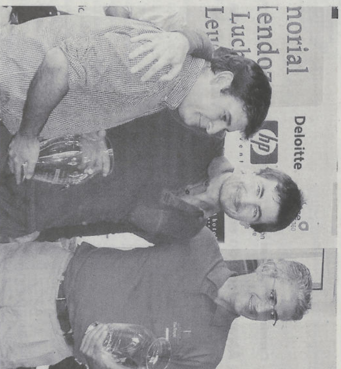
REPITE. Una imagen de la pasada edición del torneo.

Rocío Mendoza falleció en el 2006 víctima del cáncer y al año siguiente su familia decidió ren-